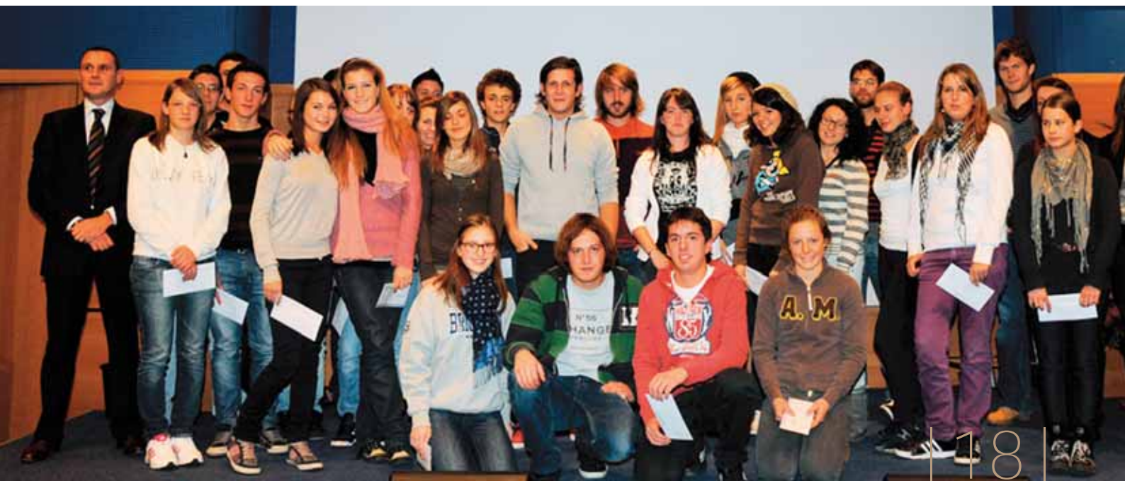
I ragazzi premiati durante la serata.