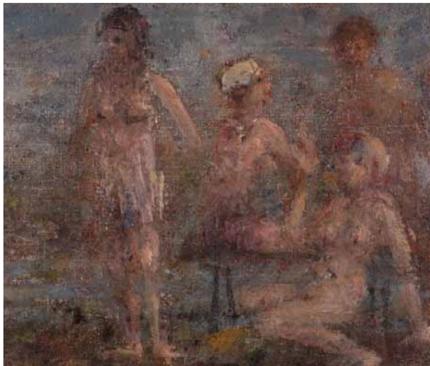
Bagnanti, olio su tela, 19x23 cm.

Ancora una volta, avvicinare un numero sempre maggiore di persone ai protagonisti della storia culturale del nostro Trentino, è un modo per restituire al Territorio il valore creato dall'attività bancaria: per questo, avvalendoci dell'eccellente collaborazione di Camillo Fedrizzi e di Carlo Frenoz, abbiamo portato a Cles ben 62 opere del "Pittore straordinario" Angelico, alcune delle quali sono esposte per la prima volta. La produzione pittorica di Dallabrida è vastissima, ma in gran parte sconosciuta o indisponibile, e frequentemente vengono scoperti dei dipinti inediti. La difficile reperibilità delle sue opere è dovuta principalmente al fatto che la maggior parte di esse non sono firmate, pertanto esistono decine di proprietari che le custodiscono gelosamente tra le mura domestiche. Non è stata un'impresa semplice, per questo motivo, scovare