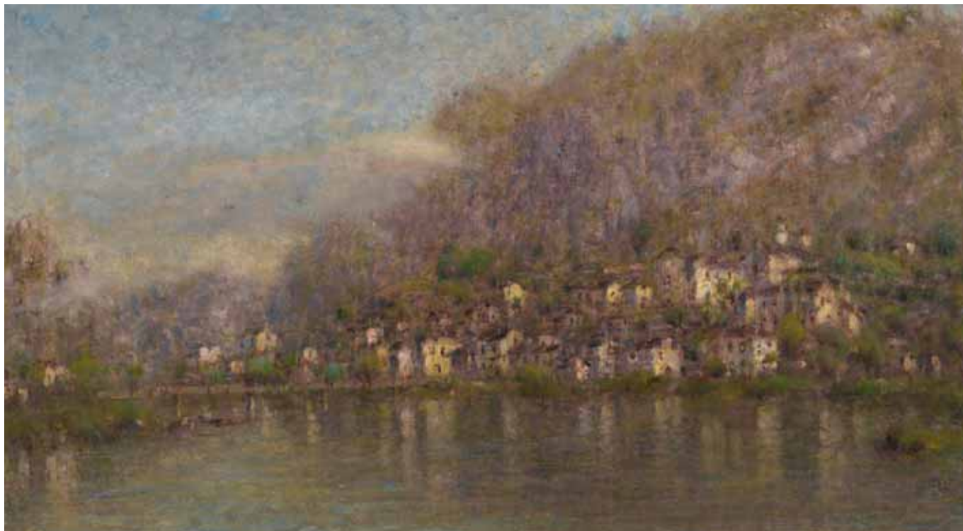
San Michele all'Adige, 1930 ca, olio su tela, 63,5x100 cm.

critici lo hanno definito il "pittore-poeta della campagna" e "l'ultimo impressionista".