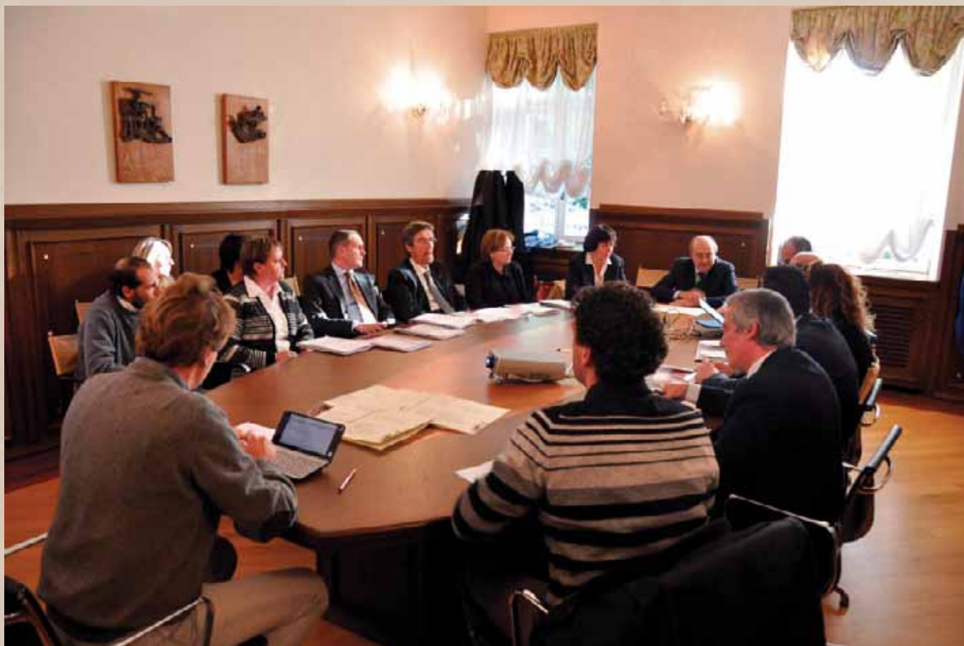
La firma dell'accordo (Archivio Ufficio Stampa Provincia Autonoma di Trento).

Alla Comunità chiediamo di tenerci d'occhio e di esserci quando costruiremo il nostro Piano per la famiglia”. Il tavolo di lavoro, con i suoi nove soggetti, avrà ora il compito di determinare le priorità da trasformare in obiettivi concreti realizzabili nei prossimi mesi.