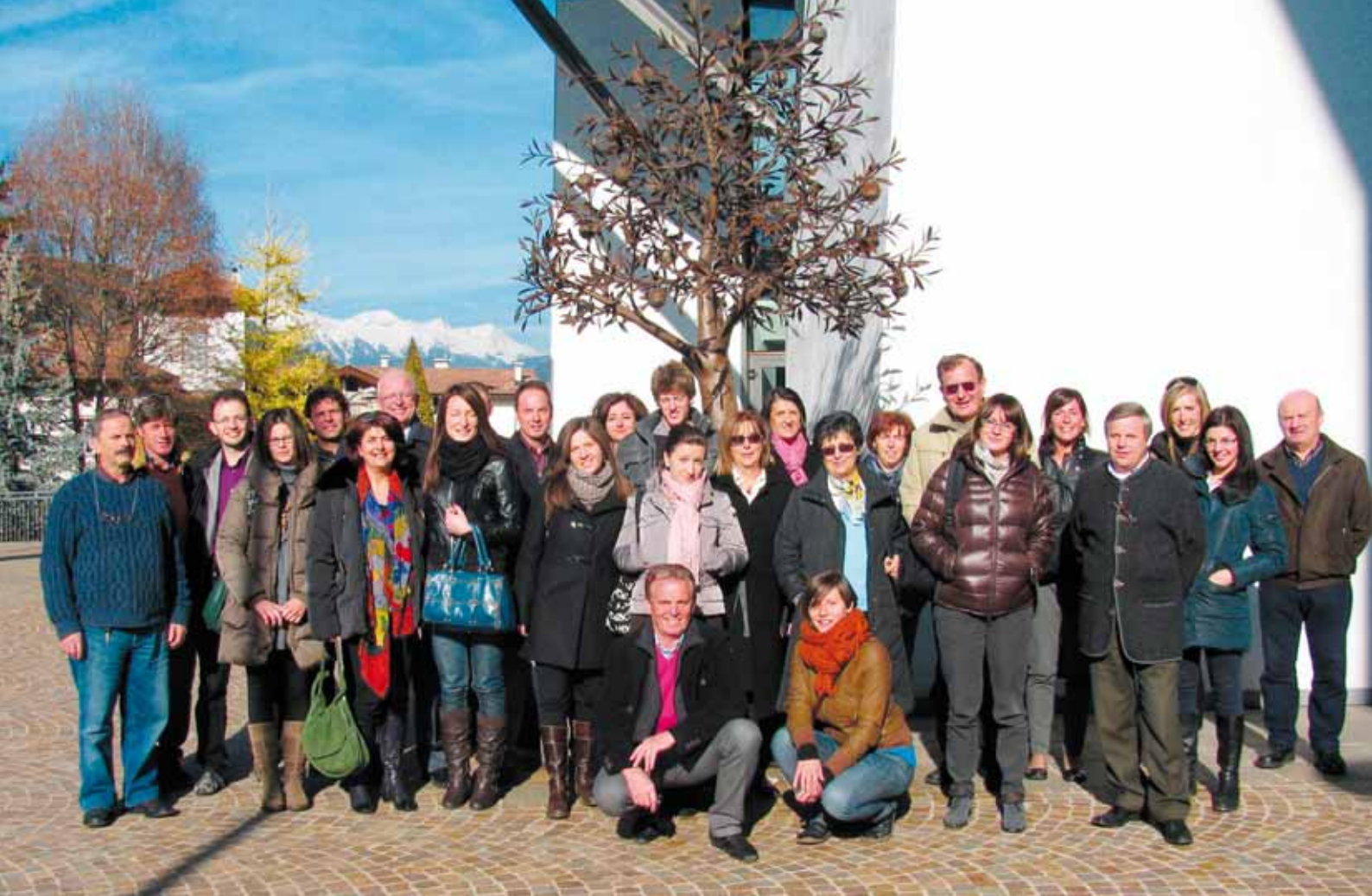
I partecipanti al corso "Far bene e, se serve, farlo sapere".

sibilità di coinvolgere il maggior numero di persone nell'interessamento all'evento (mostre o altro) o all'oggetto artistico (chiesa, borgo, museo, ecc.).