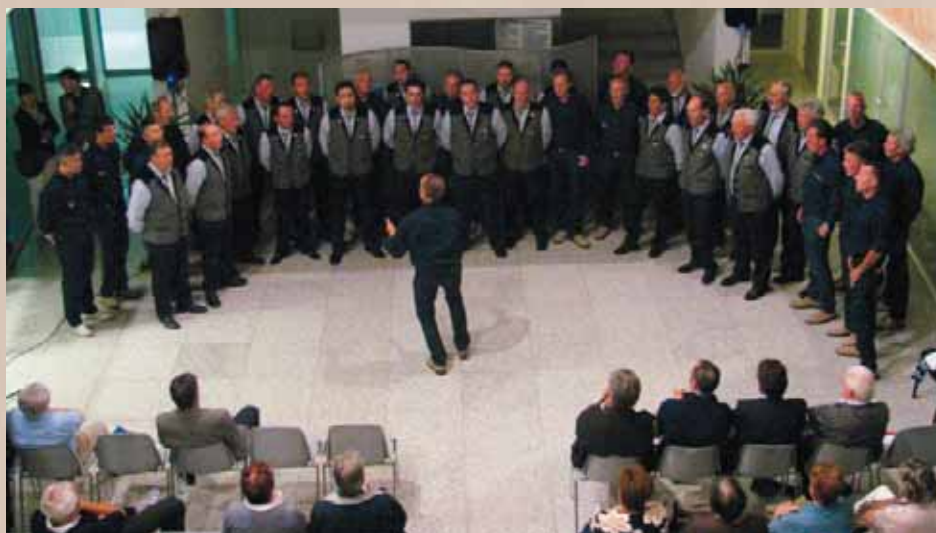
Esibizione dei cori Lago Rosso di Tuenno e Coralità Clesiana di Cles.

DUECENTO E PIÙ PERSONE A "CORI IN CON- CERTO"