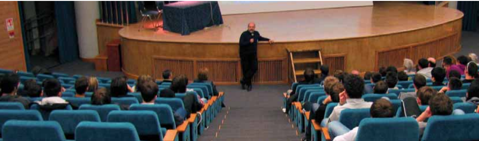
Il Professor Sacco durante l'incontro con le scuole.

Quale ruolo strategico potrebbe avere la "cultura" nello sviluppo di un territorio come la Val di Non? Questa la riflessione del prof. Pierluigi Sacco, docente di Economia della Cultura all'Università IUAV di Venezia, durante l'incontro con dirigenti, docenti e giovani studenti promosso dalla nostra Cassa Rurale giovedì 25 novembre presso l'Auditorium del Polo Scolastico di Cles. Considerazioni, quelle portate dall'ospite, con una forte sottolineatura del ruolo della cultura nella creazione di importanti opportunità di sviluppo locale, uno sviluppo nelle mani principalmente delle nuove generazioni, custodi di molte potenzialità indispensabili per propor-