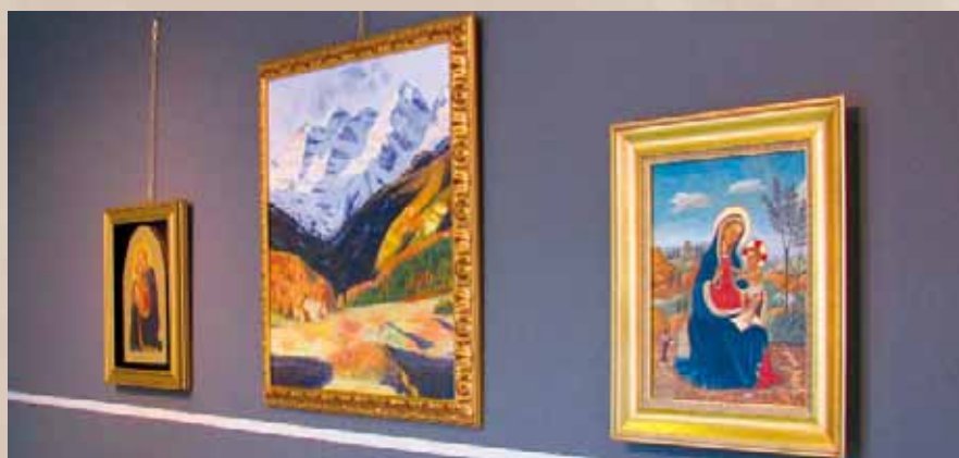
Particolare delle opere esposte.